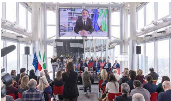
Le energie dell'acqua: un viaggio al femminile tra storie e prospettive