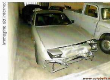
Immagine da internet