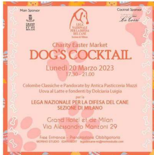
Dog's cocktail al Charity Easter Market

Al Charity Easter Market, lunedì 20 marzo (dalle 17:30 alle 21:00), Dog's Cocktail!