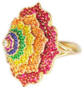
Ring 7 Chakras "Tourbillon"

I gioielli CASPITA traggono ispirazione dai sette chakra principali derivanti dall'antica spiritualità indiana e designano i sette centri di energia nella forma di fiori di loto, ognuno con un diverso colore e numero di petali. Ogni chakra rappresenta un mondo, una sensibilità, un colore e un'emozione.