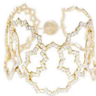
Bracelet 7 Chakras « Enchaînés »