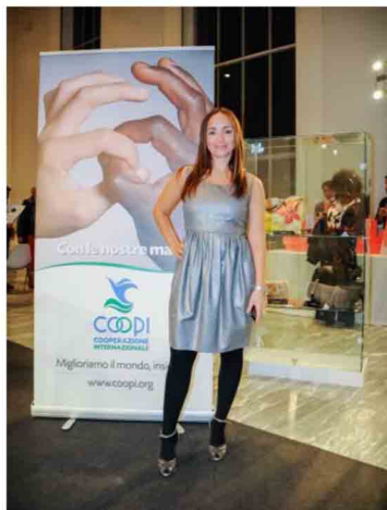
Camilla Raznovich Bags for Africa, Triennale di Milano

Ad accompagnarlo nella serata una madrina d'eccezione: la nota conduttrice televisiva Camila Raznovich che, durante la serata, ha lanciato numerosi appelli per ricordare la destinazione benefica dei fondi raccolti.