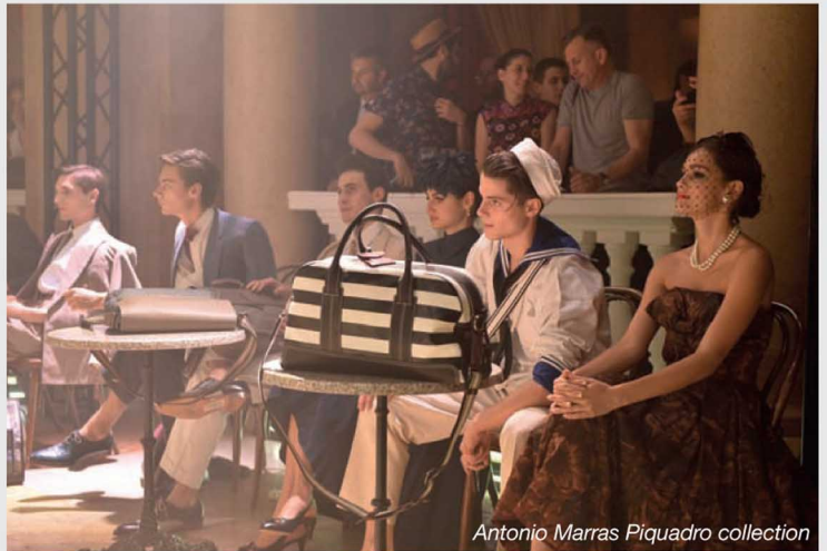
Antonio Marras Piquadro collection