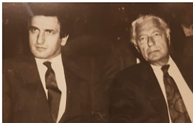
Adriano Teso e Gianni Agnelli

Cosa resterà di noi quando non ci saremo più? Crede nell'esistenza di una vita dopo la morte?