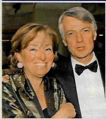
Ferruccio De Bortoli, direttore del "Corriere della Sera", con la moglie.