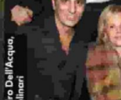
Alessandro Dell'Acqua, Anna Molinari