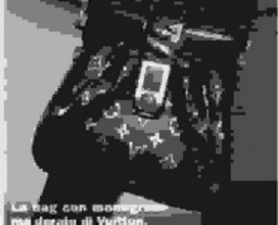
La bag con monogramma dorato di Vuitton.

stiletto da sera, una maglino di lora, una pashmina e un beauty bene attrezzato, mentre le operatrici affette da stress amy , invidie dello stress, che non lasciano mai un minuto libero alla loro giornata (vedi Madonna e Cherie Blair), riempiranno il loro carryall con rotoli di giornali, computer, materassi yoga, phon e l'apparecchio con il menu dieto. Senza rinunciare alla loro adoratissima minibag.