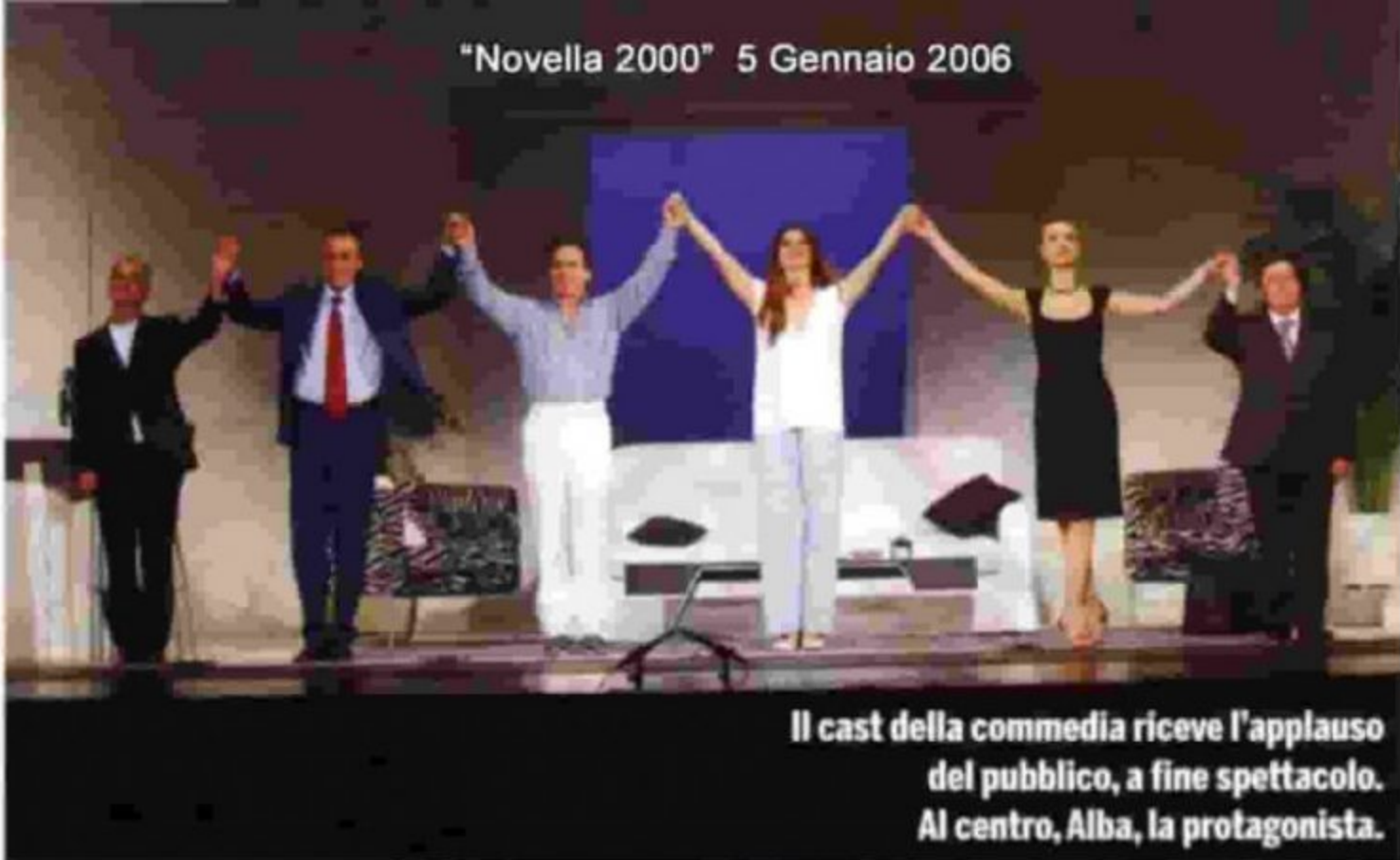
Il cast della commedia riceve l'applauso del pubblico, a fine spettacolo. Al centro, Alba, la protagonista.

La Parietti, al Teatro Nuovo di Milano, conquista il pubblico con una commedia brillante