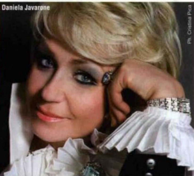
Ph. Cristina Pica