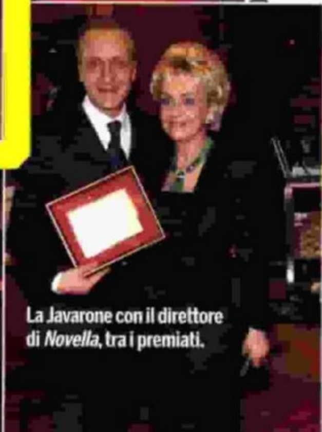
La Javarone con il direttore di Novella, tra i premiati.