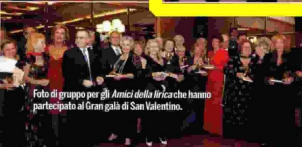
Foto di gruppo per gli Amici della lirica che hanno partecipato al Gran galà di San Valentino.