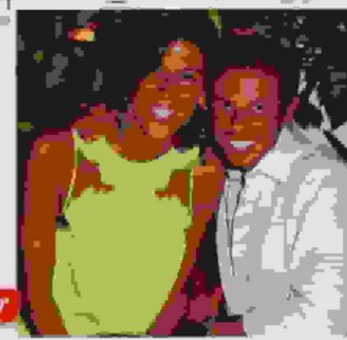
Star & manager