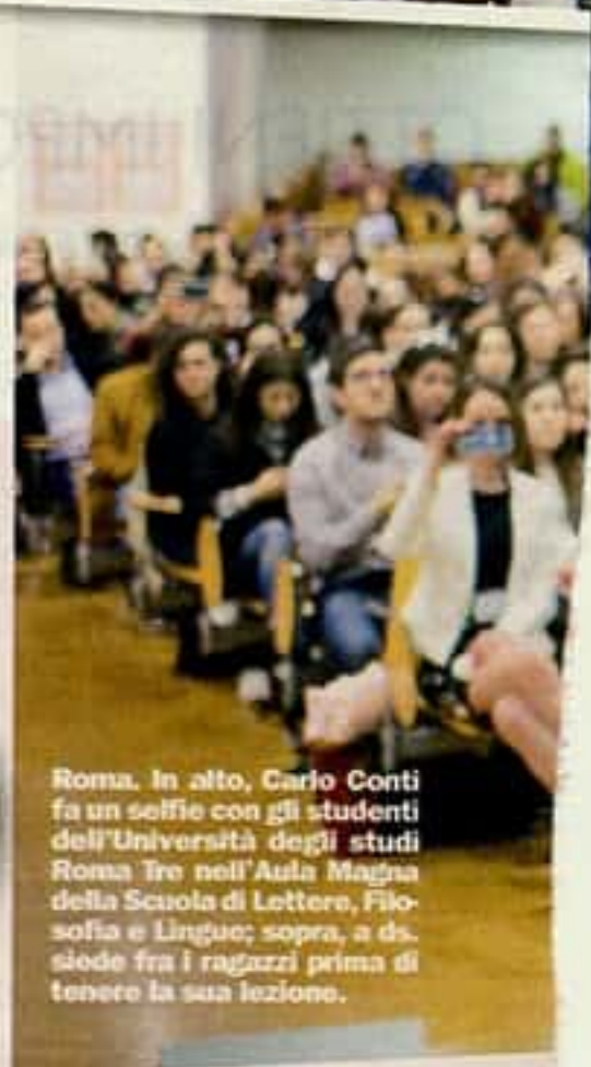
Roma. In alto, Carlo Conti fa un selfie con gli studenti dell'Università degli studi Roma Tre nell'Aula Magna della Scuola di Lettere, Filosofia e Lingue; sopra, a ds. siede fra i ragazzi prima di tenere la sua lezione.