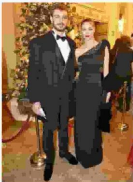
Pierre Casiraghi e Beatrice Borromeo mano nella mano per seguire «Attila»