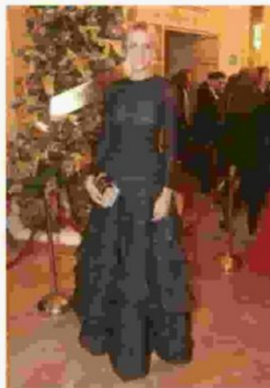
In abito rigorosamente nero mano nella mano per seguire «Attila»