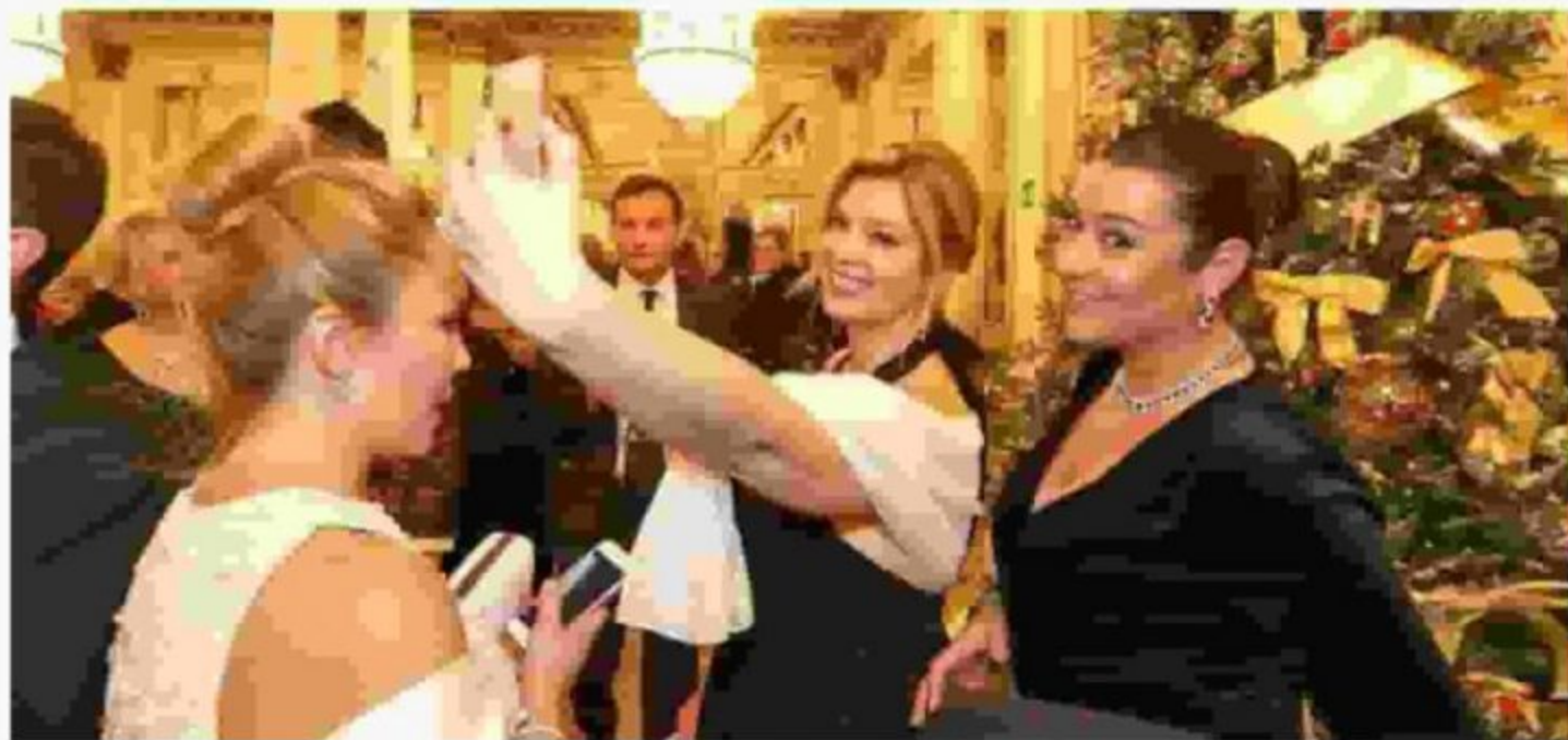
Selfie di gruppo tra le dame affezionate alla Prima della Scala: abiti in velluto nero, dress code rispettato